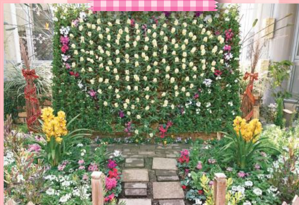
温室には緑がいっぱい