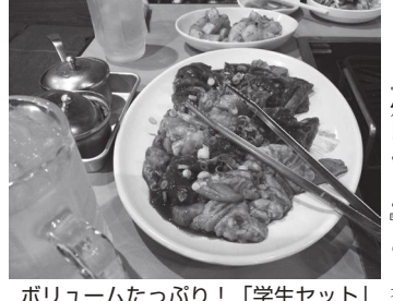
ボリュームたっぷり! 「学生セット」