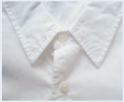
これがレギュラーカラーだ

男性のスーツは紺がおすすです。次点でグレーでしょう。黒は間違っ冠婚葬祭用を着ないように。威圧感を与えてしまう色でもあります。一番下のボタンは開けて着ましょう。座ったときにシワができてしまいます。シャツは白以外就活では禁物。襟に関してはレギュラーカラーが一番ですが、ワイドカラーやショートポイントカラーも体型にあわせて選んではいかがでしょう。その他、ボタンダウンなどの凝った襟はやめておきましょう。