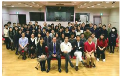
当日会場に集まった人々

について本学の学生がプレゼンテーションを行った。そして、両大学の学生の混成グループを2つ作り、それぞれでその事例の原因や解決策が議論された。2日目は、本学G号館に会場を移しさらに議論が続いた。考えられた解決策の予算や必要なもの、成果の測り方など、具体的な部分も詰めた。