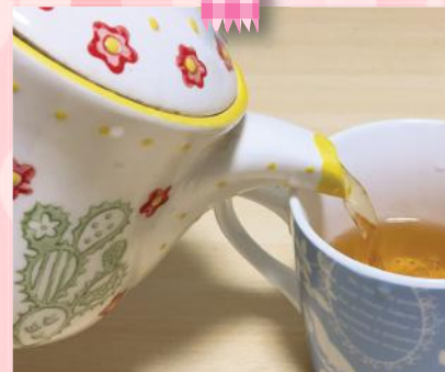
ほっ。とあるハーブティーはいかが?