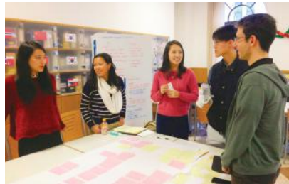
ディスカッションを重ねる参加者

を行った。12月には、その中からカンボジアの事例を当日のディスカッションのテーマに決めた。同国の中学校の高い退学率に注目し、子どもたちが学校に来ない理由や来るようにする方法などを3日間