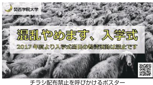
チラシ配布禁止を呼びかけるポスター

消費者の節約志向が高まる中、1皿100円という低価格を武器に回転寿司の市場は拡大を続けている。そんな中、業界の老舗であるかっぱ寿司の業績は低迷していた。価格以外で他社との差別化が遅れ、安っぽいイメージがついたのだ。かっぱ寿司は昨年からの負のイメージを払拭するべく、品質向上を中心とした改革を始めた。しかし、低価格が最大の魅力である回転寿司にとって、高級なネタを100円で提供するとはそう簡単にはいかない。赤字覚悟で販売すると決めても、材料を納入する業者の反発が大きいのだ。かっぱ寿司に卸すと、業者のブランドイメージが悪化するというのである。それでもかっぱ寿司は諦めなかった。より多くの客に届けるには100円で提供するしかない。そこには「100円で売ることが決して安売りではない」という思いがあったのだ。価値があるからこそ100円で客に届けたかったのだ。かっぱ寿司は、これからも100円の寿司を価値ある商品へと磨き続けていく。我々消費者が1円でも安い商品を求めるのは当然で、100円であれば手に取らない商品もあるはずだ。100円であることの「価値」を今こそ見直してみるべきではないだろうか。