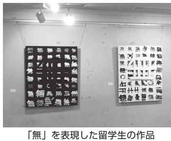
「無」を表現した留学生の作品