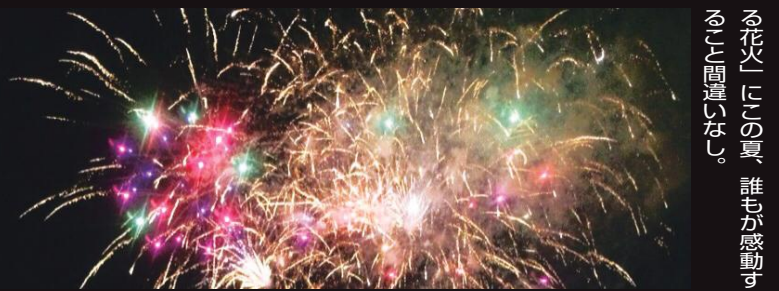
る花火」にこの夏、誰もが感動すること間違いなし。

自分たちの町を自分たちの手で作り、盛り上げる。そのような思いを胸に抱きながら毎年、市民によって開催されている花火大会、「芦屋サマーカーニバル」。今年のコンセプトは「和」だ。和太鼓グループやよさこいチームとの「コラボレーション」を交えて送る今年の花火は随所に和のテイストが取り入れられる。また、日本トップクラスの花火アーティストが魅せるエンターテインメントショー、「恋する花火」と「3D花火」も必見だ。「恋する花火」とは、恋人や奥さん、旦那さんに口頃の感謝や思いを伝える「メッセージ花火」や「プロポーズ花火」が音楽やメッセージと共に打ち上げられるというものだ。潮音屋「ビーチ」の砂浜を最大限に利用した「3D花火」の演出と、素敵な愛を届ける「恋す