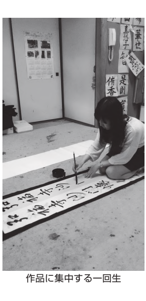
作品に集中する一回生