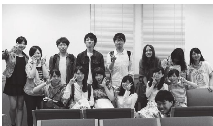
宗教総部献血実行委員会のみなさん

河「まずは、献血についての正しい理解をしてもらえたらと思っています。また、献血という怖いイメージがあると思いますが、私たちがそれを払拭できるように努めています」と考えていますので、是非勇気を出して献血に来てみて下さい！次は、秋の献血を10月5日から9日に行います。まだ参加したことのない方もチャレンジしてみてください。