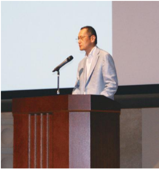
学生に向けてメッセージを贈る山中教授

その中で特に山中教授が強調したのは、自身が30代の頃にアメリカで研究をしていた際に恩師に言われた「Vision & Hard Work (VW) = 目標と努力」という言葉である。