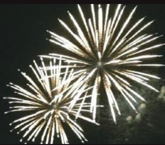
大会に足を運ぶとともに、宝塚観光も楽しんでみては。

宝塚市と宝塚観光協会が協賛して夏に行われる「宝塚観光花火大会」。この花火大会で多くの人に賞賛されているのが、なんといってもその演出の素晴らしさである。宝塚といえば、宝塚歌劇団、手塚治虫などが真っ先に思い浮かぶであろう。そこで昨年は、宝塚市制60周年、宝塚歌劇団100周年、手塚治虫記念館20周年を記念した「たからづか物語」が夜空で描かれた。約3000発の花火・音楽、そして物語が三位一体となった高度な演出は庄巻であり、今年も宝塚歌劇団を擁する宝塚市ならではの花火は多くの人々を虜にするであろう。また、駅からのアクセスも便利で、宝塚歌劇場や手塚治虫記念館からも近いため、観光にもとても便利。花火