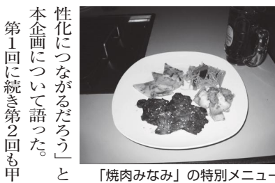
「焼肉みなみ」の特別メニュー

3月12日に第2回甲東園バルが開催された。バルとはスペイン語でパーティーのことだが、英語のパーティーよりも