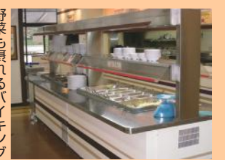
野菜も扱われるバイキング

新生活の相談にのってくれるのが、関西学院大学生生活協同組合(以下、関学生協)だ。新生学生会館1階にあるKGフォーラム店では、