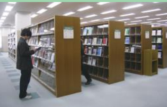
数多くの蔵書が並ぶ

入った瞬間、天井が高くゆたかりとした空間にゆたかりとした時間が流れている。1階には新着図書コーナーや先生のおすすめ本コーナー、2階には新聞の書評コーナーなど実用的な工夫がなされている。