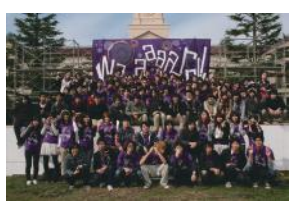
新月祭での全体写真

現在、約50人の部員がいる。アナウンス、ドラマ、報道、製作、技術の5つの研究部に分かれて活動を行っている。主な活動内容は、年に数回行われる学内でのライブである。新月祭でもライブを