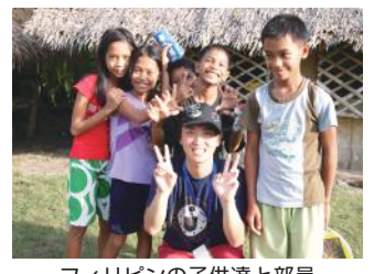
フィリピンの子供達と部員

募金活動をしている。「グローバルウィレッジワークキャンプ」では、フィリピンやインドネシアを訪れ、住居を必要としている人達と共に家作りを行う。家は生活をしていく上で必要不可欠なものであるから、ハビタットの活動の中でも代表的なものの一つである。