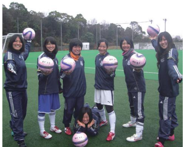
日本一を夢見るメンバーたち

一昨年に立ち上がったばかりの女子サッカー部。昨年は、リーグ戦に初参戦することができた。徐々に部員数も増え、現在10人で日々の練習に取り組んでいる。