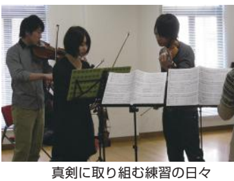
真剣に取り組む練習の日々