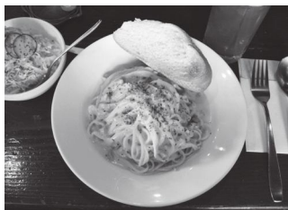
人気のパスタランチ (990円)

関学の正門のすぐ目の前の建物の2階に、知る人ぞ知る喫茶店がある。トップコーヒー関学前店だ。店内は木目調のモダンな雰囲気、ゆっくりとした時間が流れている。 トップコーヒーは1972年に創業した歴史のある喫茶店だ。関学の間では、口コミで噂が広まっている。大学の目の前ということもあり、訪れる人は大半が学生だ。しかし、先生がゼミ生を連れて足を運ぶことも多く、隠れた名店となっている。