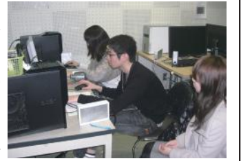
編集作業をする風景

現在、約50人の部員がいる。アナウンス、ドラマ、報道、製作、技術の5つの研究部に分かれて活動を行っている。主な活動内容は、年に数回行われる学内でのライブである。新月祭でもライブを