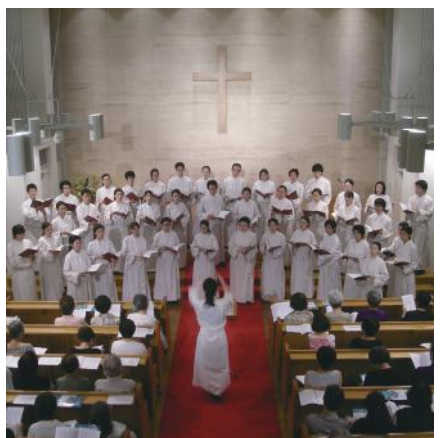
美しい歌声を響かせる

関西学院聖歌隊では、音楽チャペルや演奏旅行、定期演奏会、クリスマス礼拝など様々な活動をしている。その他にも、各地の教会に呼ばれて演奏会を開催している。