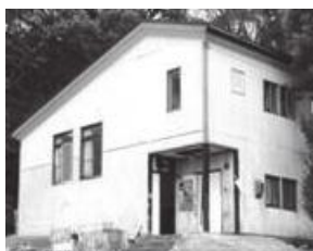
ここで様々な傑作が生み出された