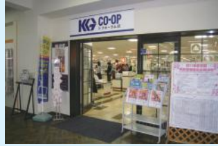
新生学生会館のKGフォーラム店

新生活の相談にのってくれるのが、関西学院大学生生活協同組合(以下、関学生協)だ。新生学生会館1階にあるKGフォーラム店では、