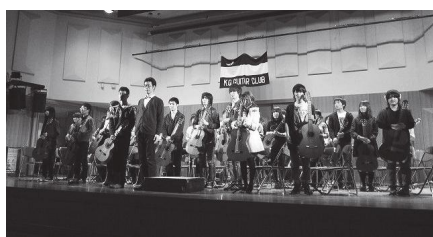
大合奏を終えた部員たち

囲碁部ではこの広いアトリエという空間を生かして、毎年11月には120号(15x20m)のとても大きな作品を制作しています。