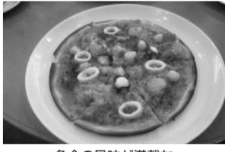
魚介の風味が満載なシーフードピザ (780円)

今回は、甲東園駅前より徒歩1分のイタリアンダイニング&カフェ「リスィイ」を紹介する。店内は、ウツド調にシンプルに整えられた明るい温かみがあり、80席ほどある。シンプルで温かみのあるインテリアが素晴らしい、ゆったりとすることが出来る。 ランチメニューのイタリアンセット(980円)は、料理一品にサラダやドリンクもついてとてもお得なセットである。料理はパスタやピザ、グラタン、オムライスなどの中から好きなものを選ぶ。中でも店長のオススメは、ズワイガニ