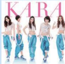
ヒット曲「ミスター」

そこで今、注目されているKARAや少女時代、BIGBANGといった大人気アーティストから、BROWN EYED GIRLSや大国男児のような今年期待の新人アーティストまでを取り上げてみた。