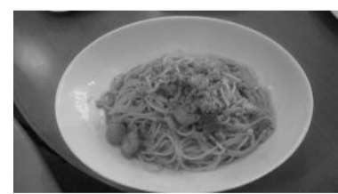
濃厚なソースが特徴のズワイガニとエビのトマトクリームパスタ

今回は、甲東園駅前より徒歩1分のイタリアンダイニング&カフェ「リスィイ」を紹介する。店内は、ウツド調にシンプルに整えられた明るい温かみがあり、80席ほどある。シンプルで温かみのあるインテリアが素晴らしい、ゆったりとすることが出来る。 ランチメニューのイタリアンセット(980円)は、料理一品にサラダやドリンクもついてとてもお得なセットである。料理はパスタやピザ、グラタン、オムライスなどの中から好きなものを選ぶ。中でも店長のオススメは、ズワイガニ