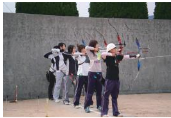
洋弓女子部員たち

練習をすればするだ け上達する洋弓は、他 のスポーツと違い、相 手との駆け引きがない ことが大きな特徴だ。