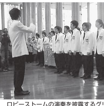
ロビーストームの演奏を披露するグリーククラブのみなさん