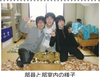
部員と部室内の様子