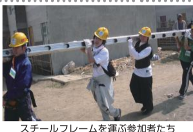
スチールフレームを運ぶ参加者たち