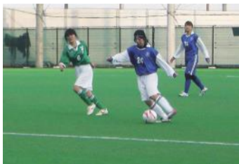
白熱する練習試合