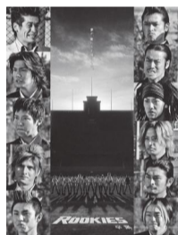
引用：公式ホームページ