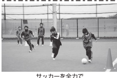
サッカーを全力で