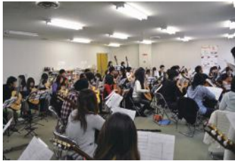
合奏練習に励む部員たち