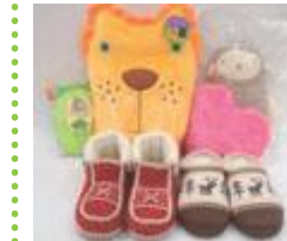
湯たんぽ&ルームシューズ特集

「リラクシング」を感じられ、シンプルで上質なライフスタイルのテーマに沿った空間になっている。品物は生地素材の良さを残したシンプルながら色が多い。色使いも落ち着いた色が多いため、綺麗な着こなしが可能だ。また本家のユナイテッドアローズと違い、ユナイテッドアローズグリーンレーベルのつけのブランドとなつて