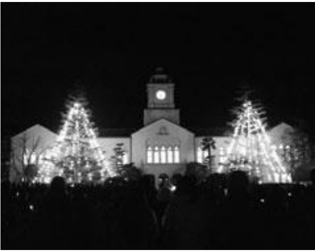
点灯した瞬間のツリー

関学のクリスマスイベントの第1弾は、点灯式である。点灯式とは、関学のシンボルとも言われる時計台の両脇に植えられている2本のモミの木にイルミネーションがつけられ、それが点灯される様子を、中央芝生に集まり見守るという実にシブールなイベントである。毎年、12月に入る週の月曜日の5限後の18時半から行われており、今回は12月1日の開催であった。