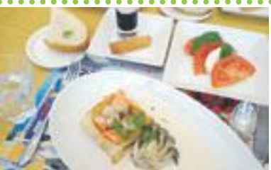
サーモンとホタテのパイケース

北海道から九州まで全国各地に教室がある「ABC Cooking Studio」の新教室が西宮ガーデンズ4階にできた。この料理教室は、先生も生徒も皆女性であるという女性限定というところが特徴である。女性限定になっているのは、レッスンをスムーズに進めることが目的だ。