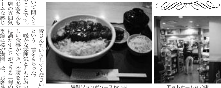
特製ジャンボソースかつ丼

最後に関学生に「メニューが豊富なので、友達やサークル仲間をお誘い合わせの上、ぜひ一度お越しください。」という一言をもらった。暖かな雰囲気とともにおいしい食事ができ、空腹を十分に満たすことができる「菊の季節に桜が満開」は、お客さんの笑顔も満開に咲かせてくれるよ。