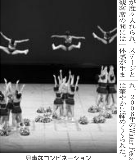
見事なコンビネーション

昨年12月19日、兵庫県立芸術文化センター KOBE LCO 大ホールにて「THE 22nd K.G. Winter Festa 2008」が開催された。チアリーダー部が主催するこの Winter Festa は、1年の活動を締めくくると同時に、今年も活動の新たな幕を開き、観客を魅了する。今年も「Dolphins Big Wave」という言葉を掲げた。会場にはたくさんの方が訪れ、入場客を巻き込みたいとの思いから「Dolphins Big Wave」は、大海をイメージしたという言葉を掲げた。会場にはたくさんの方が訪れ、入場客を巻き込みたいとの思いから「Dolphins Big Wave」は、大海をイメージしたという言葉を掲げた。会場にはたくさんの方が訪れ、入場客を巻き込みたいとの思いから「Dolphins Big Wave」は、大海をイメージしたという言葉を掲げた。