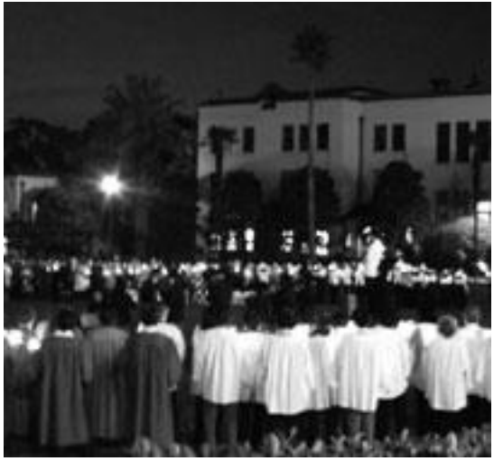
大きな輪を作り賛美歌を歌う参加者たち