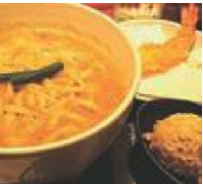
古奈屋のカレーうどん (海老天付)

西宮ガーデンズには様々な楽しみ方があるが、そのひとつに「グルメ」がある。4階の「グルメレストラン」は、24の飲食店のフロアに「栗鴨 古奈屋」が、東宮東鴨に本店を持つ人気のカレーうどん専門店である。我々記者も足を運んでみた。コシのある麺、まろやかさと辛みとがほどよいカレースープ、そして締めのカレー雑炊。普通のカレーうどんとは確かに違う美味しさを感じた。