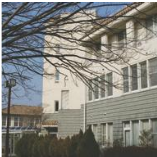
新設される西宮聖和キャンパス

木枯らしが身にしみるこの季節、受験シーズンを迎えて受験生たちが関学に集い、2009年度関西学院大学の入試が始まりを告げる。大学二極化という風潮の強い時期に関学を受験してくれることを光栄に思う。 今年度も昨年と変わらず、2月1日に始まる。例年通りF方式、A方式、センター利用入試、そして昨年から取り入れた関学独自方式の4項目に分かれて実施している。まずこの中で変更した点を紹介したい。始めに教育学部（幼児・初等教育学科、臨床教育学科）開設を予定している。教育学部の詳細は他面で掲載しているの、ここでの変更点はないが、関学独自の増加である。該当する学部は社会学部（475名から650名）、総合政策学部（480名から580名）、理