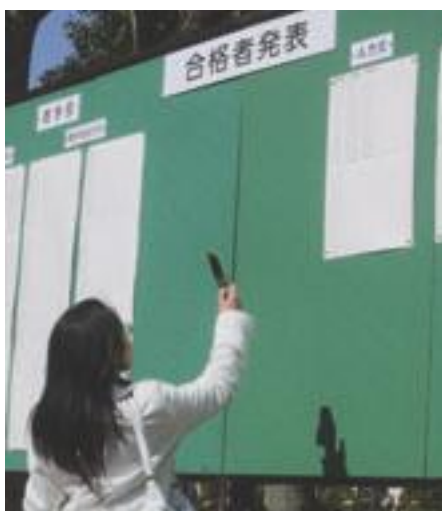
合格をつかみ取れ!

また一部の形式で「作文（自由英作）」が出題されることがある。レベルとしては標準的であるが、文法の基本表現の十分な習得や日本語の解釈などの能力が鍵となる。試験までに特に準備の必要がある。 ここまで、英語の傾向と対策について考えてきたが、どれだけ対策を練っても小さなミスをしているようでは元も子もない。入試では「一点」が合否を分ける。まずは落ち着いて深呼吸してから鉛筆を握り、時間の許す限り、何事もやり直しをしよう。一歩ずつ確実に歩んで欲しい。 センターも終わり、今年度の受験生の傾向が分かった。去年襲った世界恐慌の影響からか、国公立や自宅から通った大学の人気が高いようだ。ニュースに映る学生の多きが「親に迷惑をかけたくない」と口にする。でも、実際親は子どもが思っているほどではなからうか。息子や娘が夢を掴むことを幸せにすることを願い、受験を前に「風邪は引いていないか」「ハンカチは持っているか」「電車で遅れないか」と気をまんんでいるのだ。