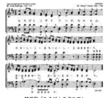
賛美歌「もろびとこぞりて」