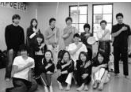
サークルの皆さん

練習は、初心者にやさしい。音楽に合わせてセッションや特殊な動きをするところから、ダンスと