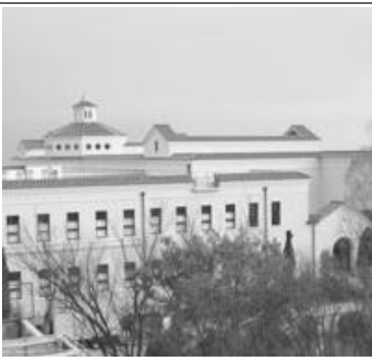
旧学生会館から見たG号館

このG号館は、地上3階(一部4階)地下1階で、H型の本棟と道路側のラウンジ棟の2つに分かれている。本棟には、教室や研究室、院生室、チャペル、図書室、資料室などの研究設備が収容される。これは主に、この春から新しく開設された人間福祉学部の教育、研究の拠点だが、大小あわせて47ある教室のうち、37は全学部共通なので、春学期からの時間割にG号館の教室が登場することとなる。そのうち大教室が4つあり、600人規模の教室が1階に1部屋、200人の教室が2階に2部屋、300人の教室が3階に1部屋ある。また、学生サービスセンターの1階にあった国際教育・協力センター国際教育・協力課と第4別館の2階にあった言語教育センターがそれぞれ本棟の1階に移転した。ラウンジ棟は地上2階建てで、1階にはコンビニとカフェが入る。コンビニには、昨年度まで第4別館の裏にあったファミリーマートが、以前より広くなって移転する。カフェには、「カフェ・ド・クリエ」という店舗が入る。メニューはコーヒーがメイン