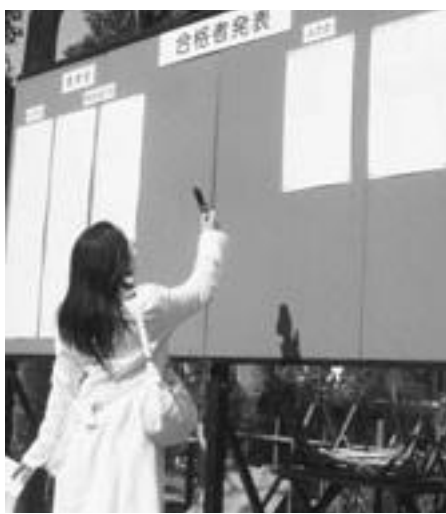
自分の受験番号を撮る受験生