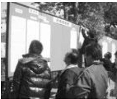
多くの受験生が集まった

そうですね。自宅から近いので、通学しやすいということもありますが、やはり明るく自由な雰囲気があると思うのでこの大学を第一志望にしました。