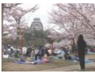
姫路城と美しい桜

国宝に登録されている姫路城は毎年多くの花見客が訪れる人気のスポットである。約1000本の桜が咲き乱れる風景には圧巻だ。また桜のライトアップも催されており、昼とはまた違う桜の一面を見ることが出来る。姫路城のライトアップと共に幻想的な夜を過ごしてみるのも良いだろう。 開花予想は4月上旬である。また駅から近いので交通機関を使わずに行くことも出来る。姫路の城下町を歩きながら桜を観賞することで、日頃の慌ただしい時間の流れを忘れることができるだろう。悠久の歴史を感じながら美しい桜を観賞できる贅沢なスポットの一つである。