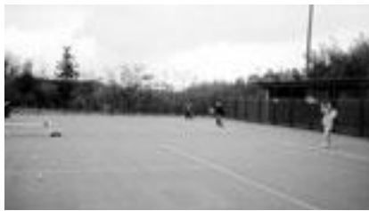
自然の中でテニス

三田キャンパスの学生にとって、テニスサークルと言えばK.G.Wingと答える人がほとんどであろう。今回は、そのK.G.Wingを紹介したいと思う。 今回の取材では、部長と1回生の部員一人に様々な質問を投げかけてきた。