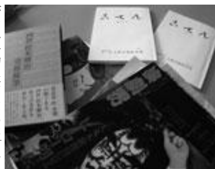
写真右上が「こてん」

定期の活動日は木曜日の部会で、活動の計画や進捗状況の確認をしていくが、部員のスケジュールに合わせる以外では息抜きや勉強を主に部室を使う部員も多いという、ゆったりとした感じである。