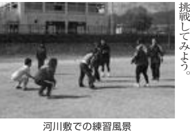
河川敷での練習風景

練習は、初心者にやさしい。音楽に合わせてセッションや特殊な動きをするところから、ダンスと