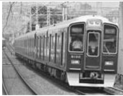
関学生の足、阪急電鉄

今回は、私たちが日ごろ何気なく利用している鉄道について記してみようと思う。私たちがとって最もなじみの深い電車といえは、おそらく阪急電鉄であろう。それは、もち