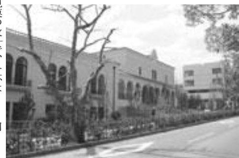
道路から見たG号館

だが、大小あわせて47ある教室のうち、37は全学部共通なので、春学期からの時間割にG号館の教室が登場することとなる。そのうち大教室が4つあり、600人規模の教室が1階に1部屋、200人の教室が2階に2部屋、300人の教室が3階に1部屋ある。また、学生サービスセンターの1階にあった国際教育・協力センター国際教育・協力課と第4別館の2階にあった言語教育センターがそれぞれ本棟の1階に移転した。ラウンジ棟は地上2階建てで、1階にはコンビニとカフェが入る。コンビニには、昨年度まで第4別館の裏にあったファミリーマートが、以前より広くなって移転する。カフェには、「カフェ・ド・クリエ」という店舗が入る。メニューはコーヒーがメイン