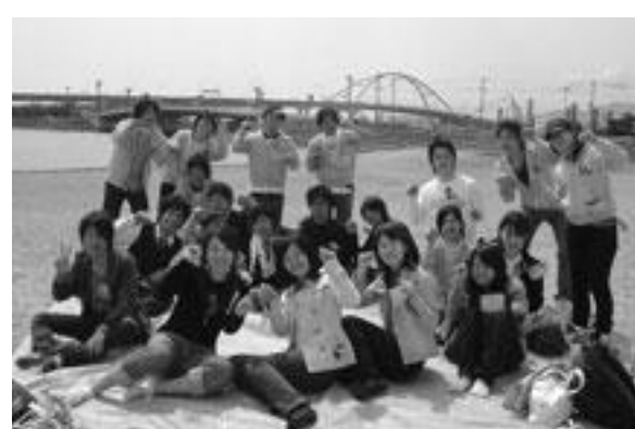
去年の新歓イベントの様子

法学部自治会が行っている主な活動内容は、法学部生の勉強面でのサポートと法学部生を中心とした学生交流行事。勉強面でのサポートとしては、法学部のあらゆるゼミのレジュメや判例のコピー、六法全書や辞書の貸し出し、そして法学部図書室の開放がある。法学部図書室はA号館地下にある。