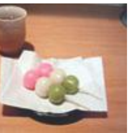
おいしそうな花見団子

独特の風習であり、現在も夜桜を催す会が開かれている。花見は日本の伝統行事である。近年の花見では照明設備も整備され桜の美しさを更に観賞できるようになった。しかしマナーの悪い人間も増加している。伝統行事を受け継いでいく意味でも、マナーを守り花見をしたいものである。