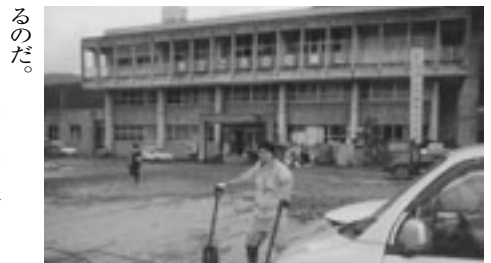
福井でのボランティア活動

山登りは主に夏と冬。夏山では「縦走登山」、冬山ではスキーをする。さらに、登山道ではなく草の生い茂った所を歩いていく「藪漕ぎ」など普通の登山とは異なる。また、山登り以外にも、自転車や北海道への旅、普段お