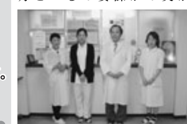
スタッフのみなさん

最後に、保健館を利用する際には必ず診療時間を確認してもらいたい。各科の最新の診療時間は保健館及び学部の掲示板に掲示してある。また、神戸三田キャンパスの第二厚生棟には保健館の分室があり、内科の診察が行われている。こちらも目により時間が異なるので、注意が必要だ。