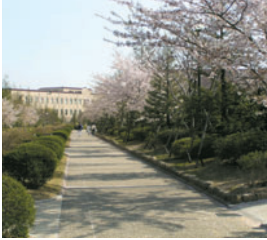
神戸三田キャンパス