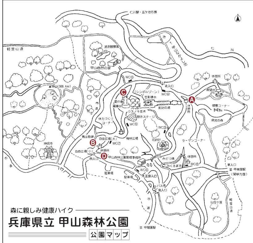
森に親しみ健康ハイク 兵庫県立 甲山森林公園 公園マップ

西入り口から出てすぐ左にある細い道を行くと大きな岩の塊がある。その上に立つと、はるか遠くまで一望することが出来る。天気の良い日は弁天町、天王寺あたりまで見ることが出来る。目がいい人は通天閣も見つけられるかもしれない。地図にはのっていないところだ。特に、平日昼間に